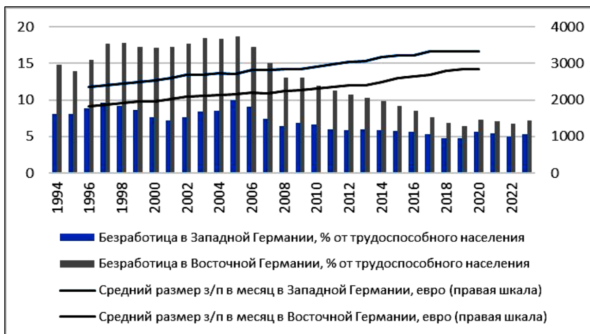
Рис. 3. Показатели благосостояния населения Германии по регионам, 1990–2023 гг.

шала соответствующий показатель для старых земель почти на 6%: на востоке средний уровень безработицы в рассматриваемом периоде составил 12,8%, на западе – менее 7% (рис. 3). Примечательно, что пиковые значения по безработице в новых землях (колебания в коридоре 17–19%) приходятся на рубеж веков и совпадают с третьей волной массовой миграции на запад. Кроме того, в данном периоде (2000–2004) также наблюдается наибольший разрыв в уровне безработицы между западом и востоком, достигавший 9–10%. Сокращение доли безработных в структуре населения Восточной Германии началось в 2006 г. и продолжалось до 2019 г. Замедление темпов этого сокращения со временем привело к стабилизации показателя, значение которого на сегодняшний день все еще остается выше, чем в Западной Германии.