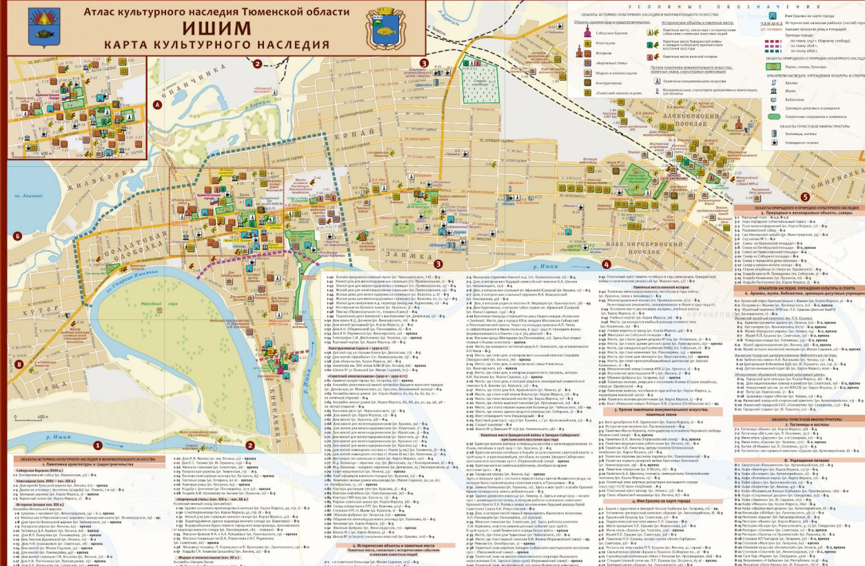
Рис. 1. Карта культурного наследия Ишим

В целом карта культурного наследия Ишима была сформирована на одном листе, где были представлены: собственно карта (в масштабе 1: 18 000), условные обозначения, полный перечень показанных на карте объектов (включающий около 250 наименований), а также отдельная картографическая врезка на центральную часть города [Ишим, 2019]. На обороте листа карты помещена краткая информация об Ишиме и фотографии наиболее интересных достопримечательностей (рис. 2).