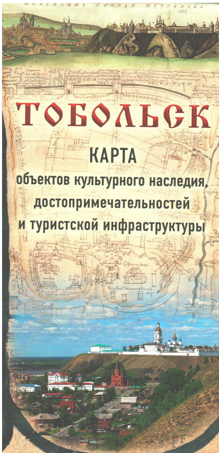
Рис. 6. Обложка карты объектов культурного наследия, достопримечательностей и туристской инфраструктуры Тобольска

ставлению картографической легенды и типов картографических знаков для создания подобных карт наследия. Картографический подход позволяет также сформировать грамотный материал в помощь туристам, школьникам и всем другим лицам, интересующимся историей и культурой России.