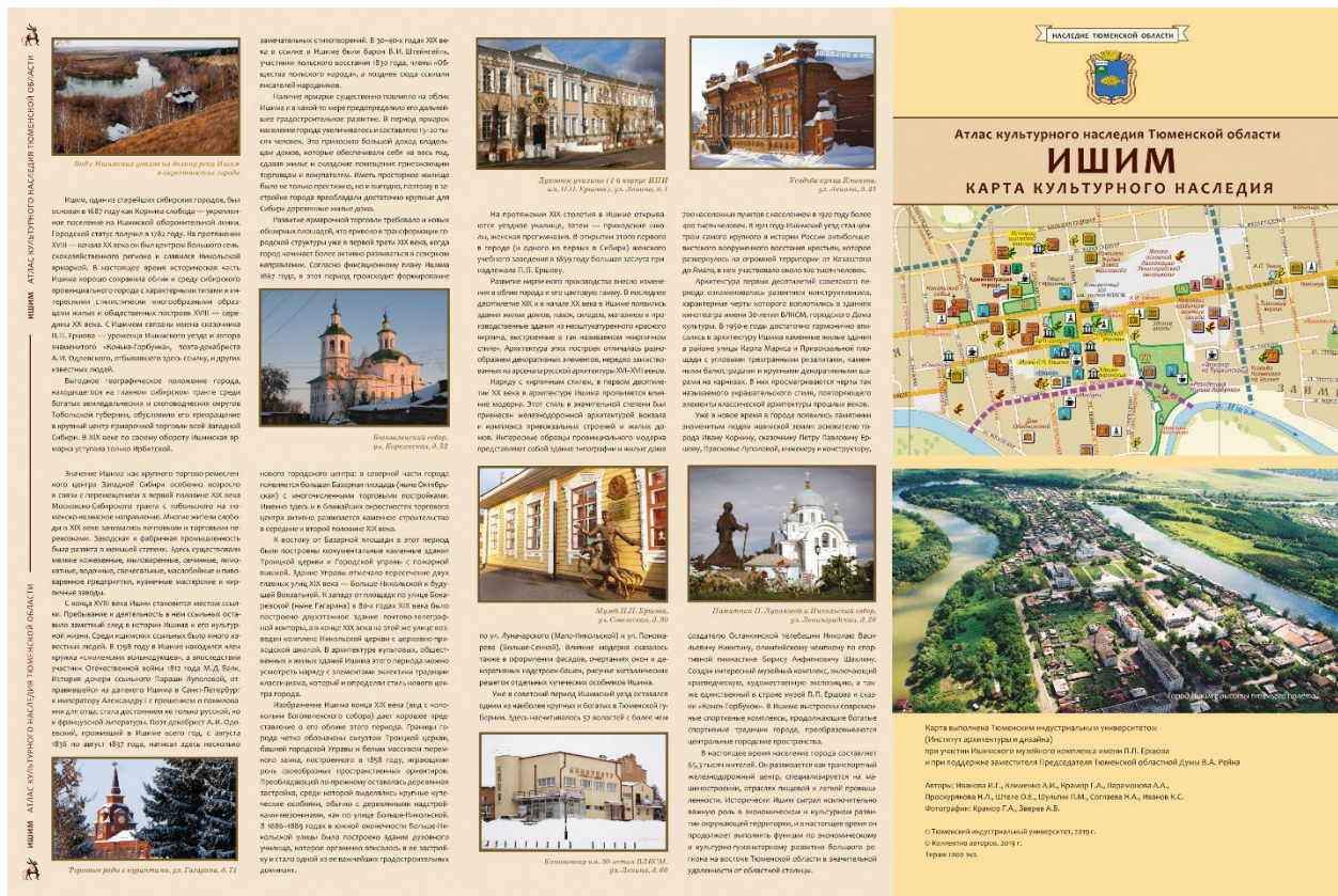
Рис. 2. Оборот карты культурного наследия Ишима

Разработанная легенда картографических изображений может быть усложнена при показе на листе карты, например, одновременно с объектами наследия также и их датировки. Для этого к системе условных обозначений добавляется цветовая гамма, отражающая время создания того или иного памятника архитектуры, археологии или время исторических событий (рис. 3). Однако на примере карты Ишима подобная детальная датировка не потребовалась.