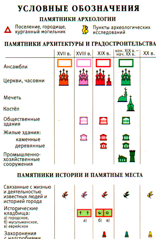
Рис. 3. Фрагмент легенды карты культурного наследия с использованием условных знаков, показывающих датировку объектов наследия

В 1989 г. в Елабуге был создан музей-заповедник. К настоящему времени можно сказать, что весь исторический центр города отреставрирован, музеефицирован и фактически представляет собой музей под открытым небом. На базе музея-заповедника сформировано более десяти различных по содержанию музейных экспозиций, ведется активная работа по привлечению посетителей; Елабуга сейчас принимает около полумиллиона туристов в год.